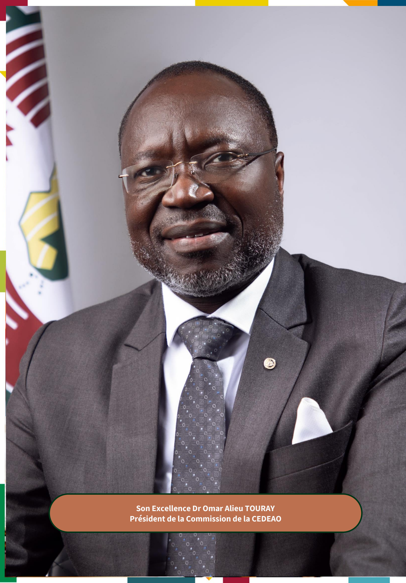
Son Excellence Dr Omar Alieu TOURAY Président de la Commission de la CEDEAO