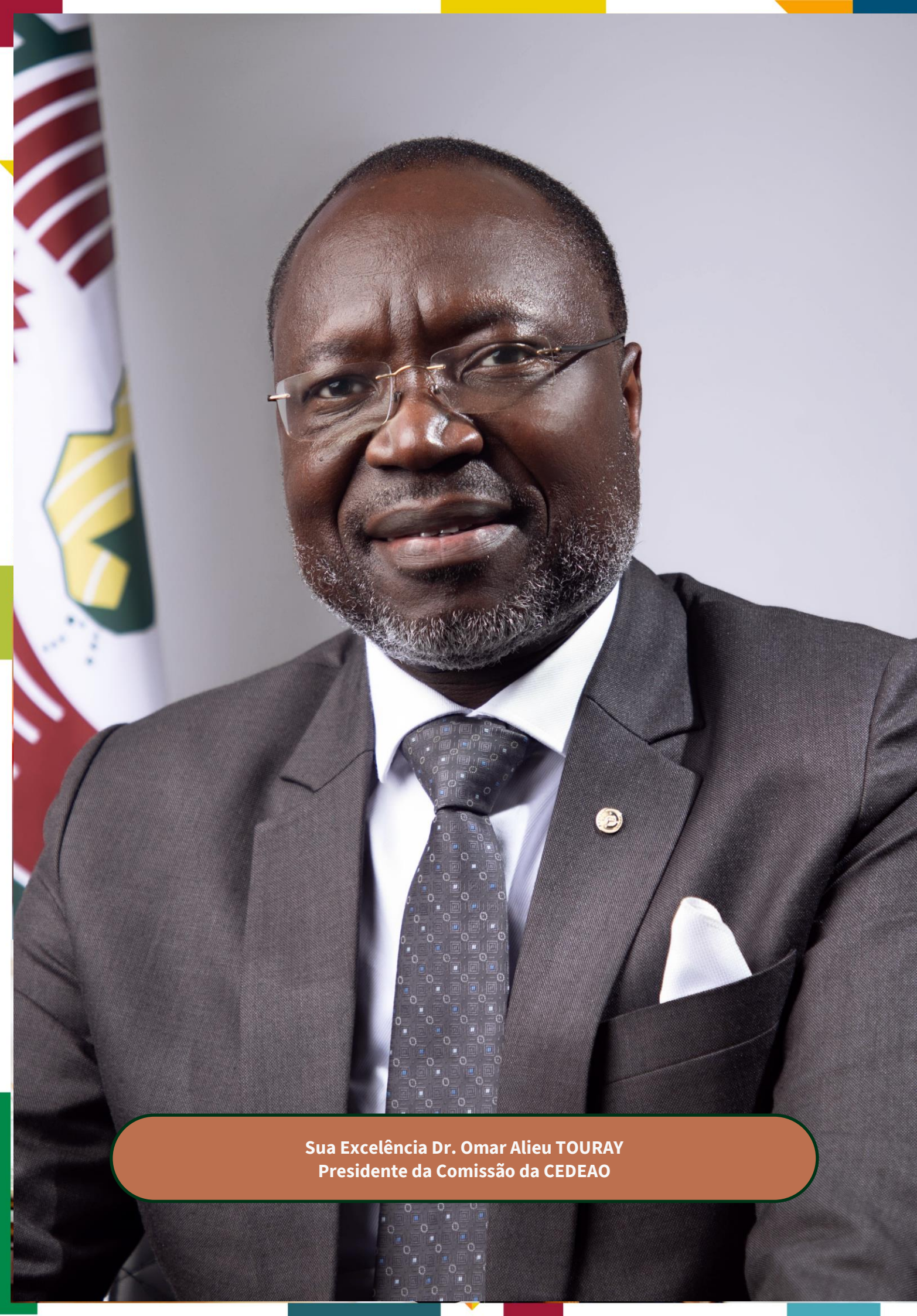
Sua Excelência Dr. Omar Alieu TOURAY Presidente da Comissão da CEDEAO